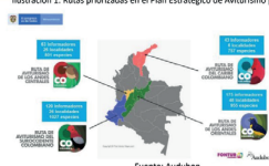
Ilustración 1: Rutas priorizadas en el Plan Estratégico de Aviturismo para Colombia