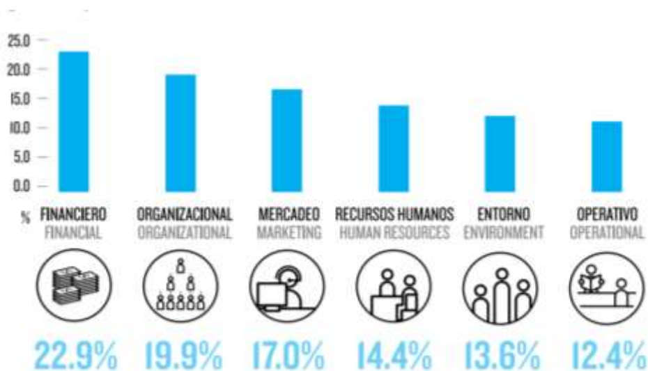
Gráfica 1. Principales factores que inciden en el fracaso de los emprendimientos.

Con respecto a los indicadores del GEM, en Colombia, la tasa de emprendimiento temprano (emprendedores nacientes y nuevos) es de 24% lo cual significa un alto nivel de actividad emprendedora en el país, ubicándolo en el octavo lugar a nivel mundial y en el tercer lugar en Latinoamérica. Sin embargo, en términos de condiciones e infraestructura para el emprendimiento, el país todavía tiene puntajes por debajo del promedio en más de nueve categorías básicas, lo cual repercute en un bajo nivel de internacionalización de los negocios, innovación y aplicación de nuevas tecnologías.