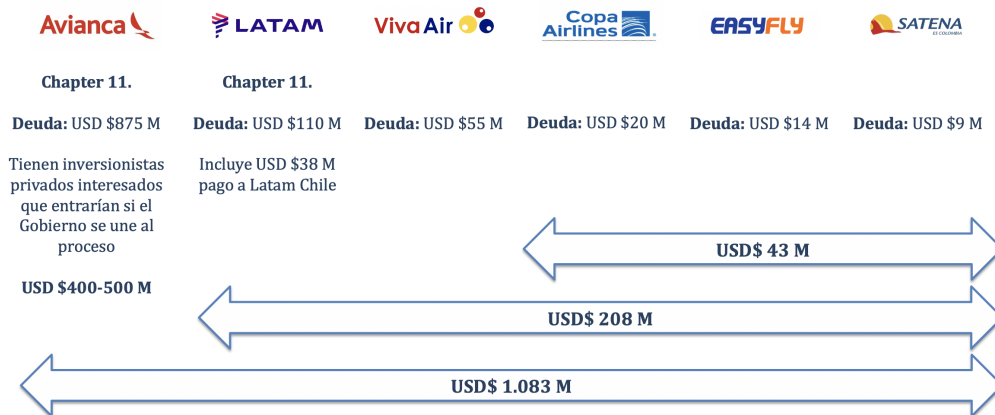
Cuadro 10: Solicitudes Aerolíneas